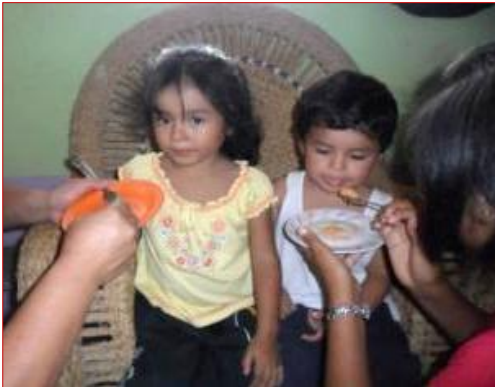
Niños reciben Chispitas Nutricionales regularmente.

¡Gracias Catholic Medical Mission Board – CMMB! Por acompañarnos en esta misión.