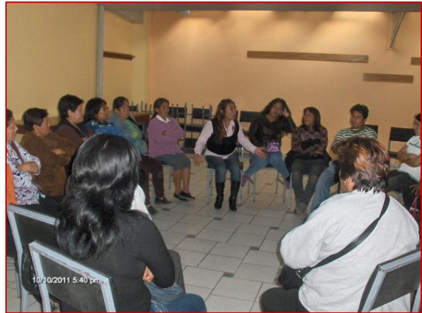
Se tuvo una Reunión en la oficina de la Comisión de Justicia Social, para compartir muchos recuerdos.