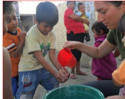
Ensañando la importancia de lavarse las manos.