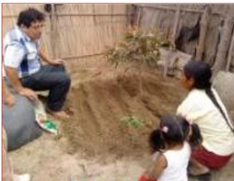
Aprendiendo a cultivar verduras en casa.

Un 01 de Setiembre del 2010, Servicios de Salud Integral "Santa Clara", asumió la tierna misión encomendada por nuestra Congregación Hermanas de La Caridad del Verbo Encarnado: "Bajar los niveles de desnutrición crónica en los niños menores de 5 años, en la zona de Cambio Puente" , a través del proyecto "Sembrando Infancia".