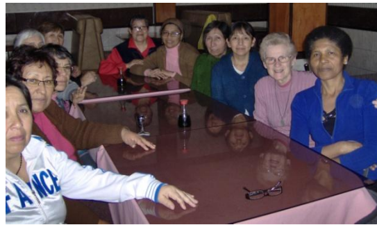
Compartir de la Comunidad de Asociadas Claudio María Dubuis junto a dos Asociadas de Chimbote y las Hermanas.